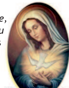
El Espíritu Santo descenderá sobre ti.

Partiendo de este y otros textos bíblicos fundamentales y de los primeros símbolos de fe sabemos que la acción del Espíritu Santo en María fue constante y decisiva. Lo es en la predestinación de María a su singular misión; en la predicación profética relativa a María; en su inmaculada concepción; en la presentación y estancia de María en el Templo; en los esponsales de la Virgen con san José. Pero particularmente esta acción es significativa en la maternidad inmaculada y divina de María. El Espíritu la santificó y así habitó en ella. Esta maternidad es fundamental para entender su maternidad espiritual respecto a los cristianos.